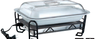
④BSウォーマースタンド セット