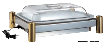
①BSウォーマースタンド セット