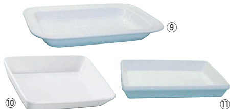
BSウォーマー用 耐熱フードパン (陶器製)