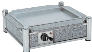
⑥ビュッフェ ウォーマースタンド