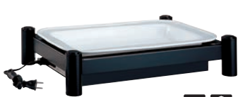
③BSウォーマースタンド セット