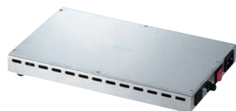
⑭SW電気ビュッフェウォーマー