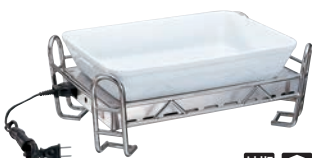
⑤BSウォーマースタンド セット