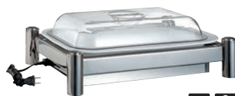
②BSウォーマースタンド セット